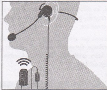
WA21 - WA29 - WA31